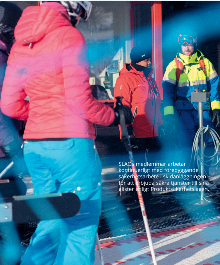
SLAO:s medlemmar arbetar kontinuerligt med förebyggande säkerhetsarbete i skidanläggningen för att erbjuda säkra tjänster till sina gäster enligt Produktsäkerhetslagen.